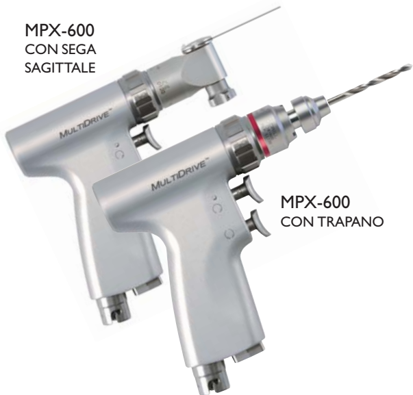
MPX-600 CON TRAPANO