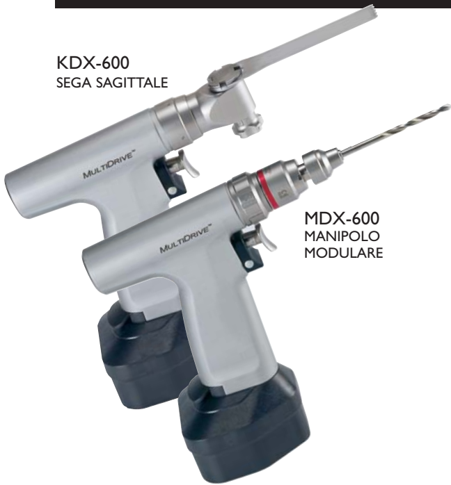
MDX-600 MANIPOLO MODULARE