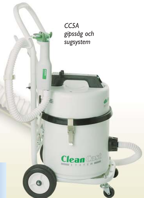
fråga efter gipssågs katalog 113