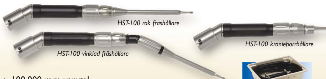
HST-100 rak fräshållare