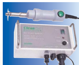
NS3A nätdrivet modulsystem