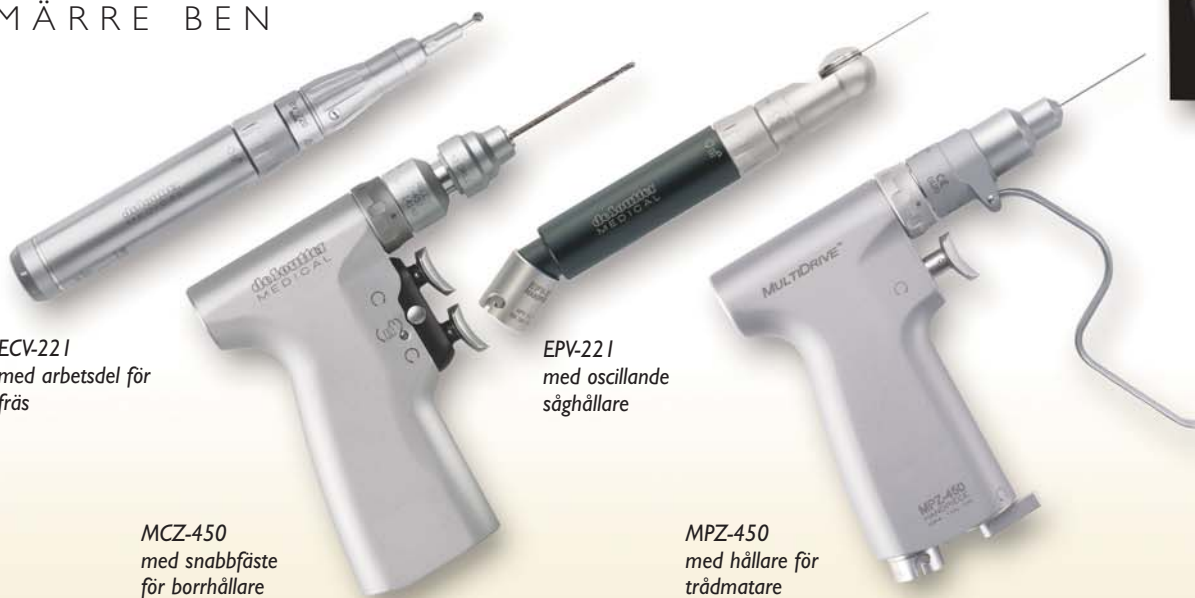
ECV-221 med arbetsdel för fräs