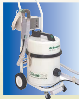
CNS3A såg och sugsystem