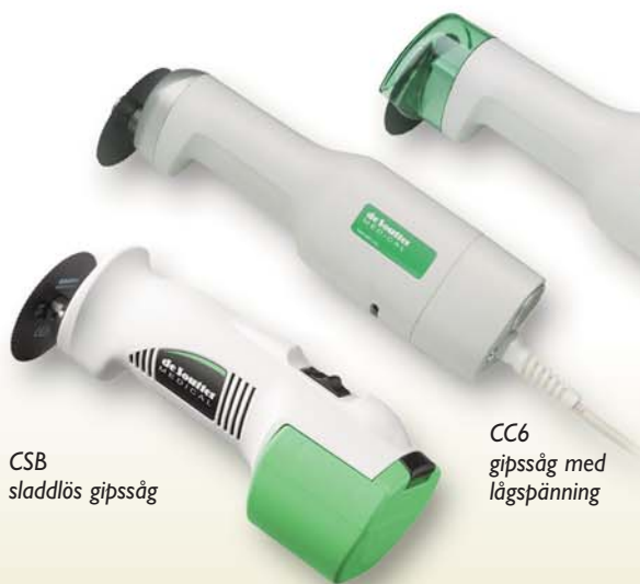
CSB sladdlös gipssåg